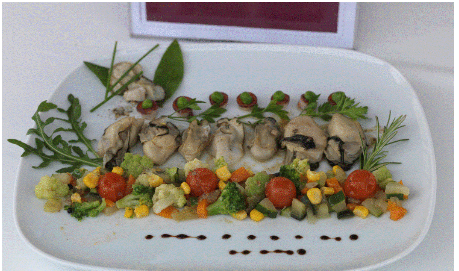
Plat Mostra de Cuina