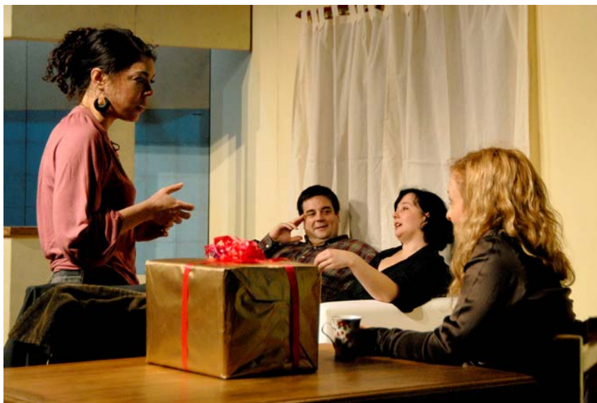
El desarrollo de la civilización venidera