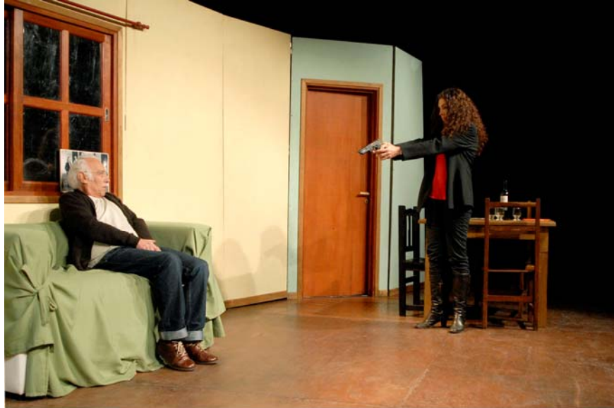
Todos los grandes gobiernos han evitado el teatro íntimo

Todos los grandes gobiernos han evitado el teatro íntimo habla de Hedda Gabler, la protagonista de la obra homónima que Ibsen escribió en 1890. Hedda es una estrecha refinada, egoísta, obstinada, caprichosa y contradictoria que no consigue adaptarse a la pequeña vida burguesa que acaba de iniciar con su marido, pero que tampoco se atreve a romper con este estatus para hacer realidad sus sueños. Acaba destruyendo todo lo que la envuelve, incluso a ella misma.