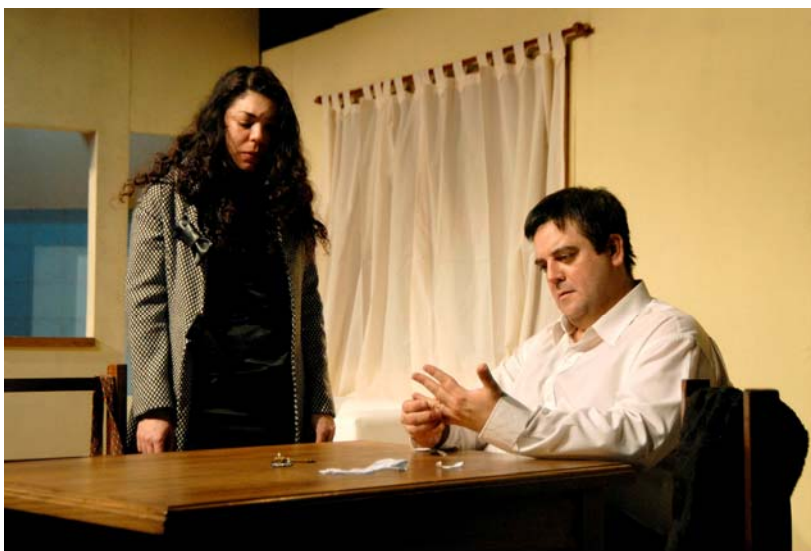
El desarrollo de la civilización venidera

Veronese intenta responder a la pregunta que todavía resuena en la mente de los espectadores de finales del siglo XIX: volverá a casa Nora? O, quizá, Nora preferirá quedarse en casa con la familia como hará después Hedda? Esto explicaría el título (que como los anteriores es complejo y enigmático) del nuevo montaje de Veronese .