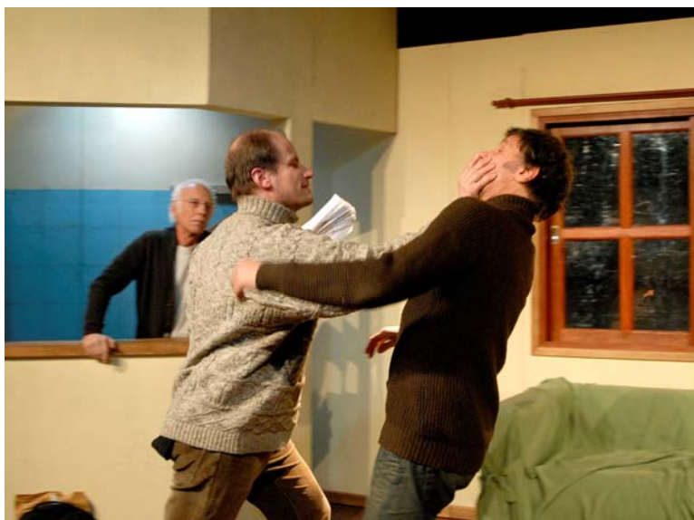
Todos los grandes gobiernos han evitado el teatro íntimo