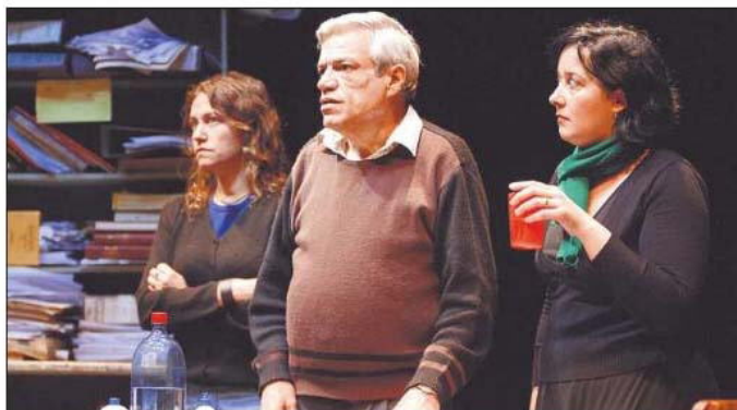
TRÍO DISFUNCIONAL. — Los actores de “Tercer cuerpo” vivirán en Chile durante un mes.