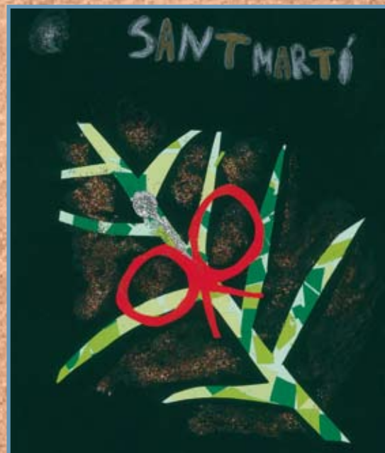
Ariadna Pons Soler, menció especial 2n curs