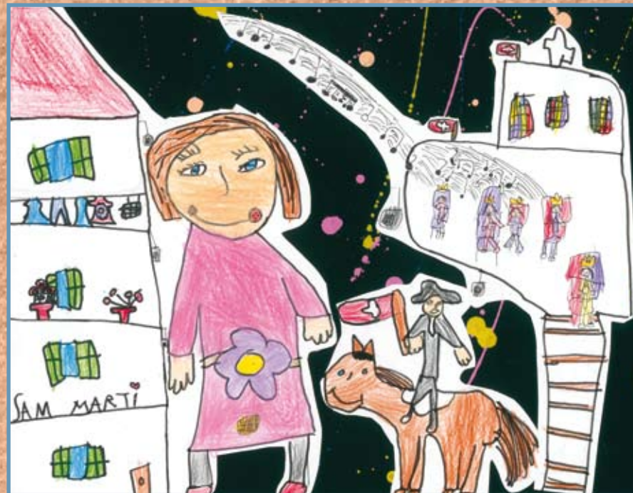
Fiona Riudavets, menció especial 1r curs