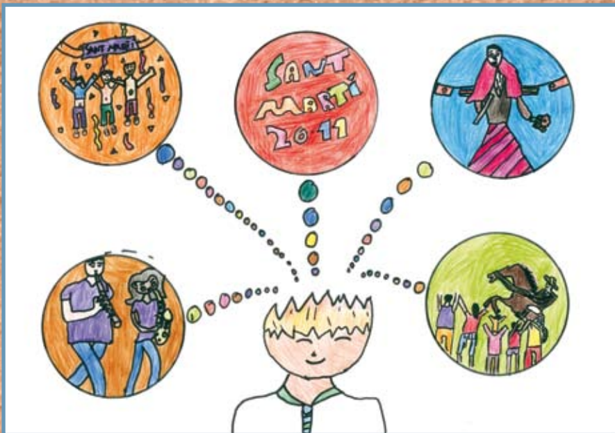
Barhomeu Mora Coll, menció especial 6è curs