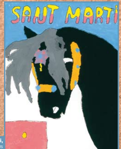
Yassine Bouazzaoui, menció especial 5è curs