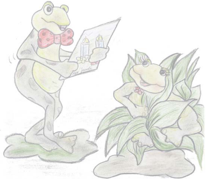
Portada: Carme Canal Colomé Cartell finalista de la Gala de les Preses 2010

A continuació, a la plaça Major, BALL DELS GEGANTS, CALABOTINS i la GRANOTA , amb els GEGANTERS I GRALLERS DE LES PRESES .